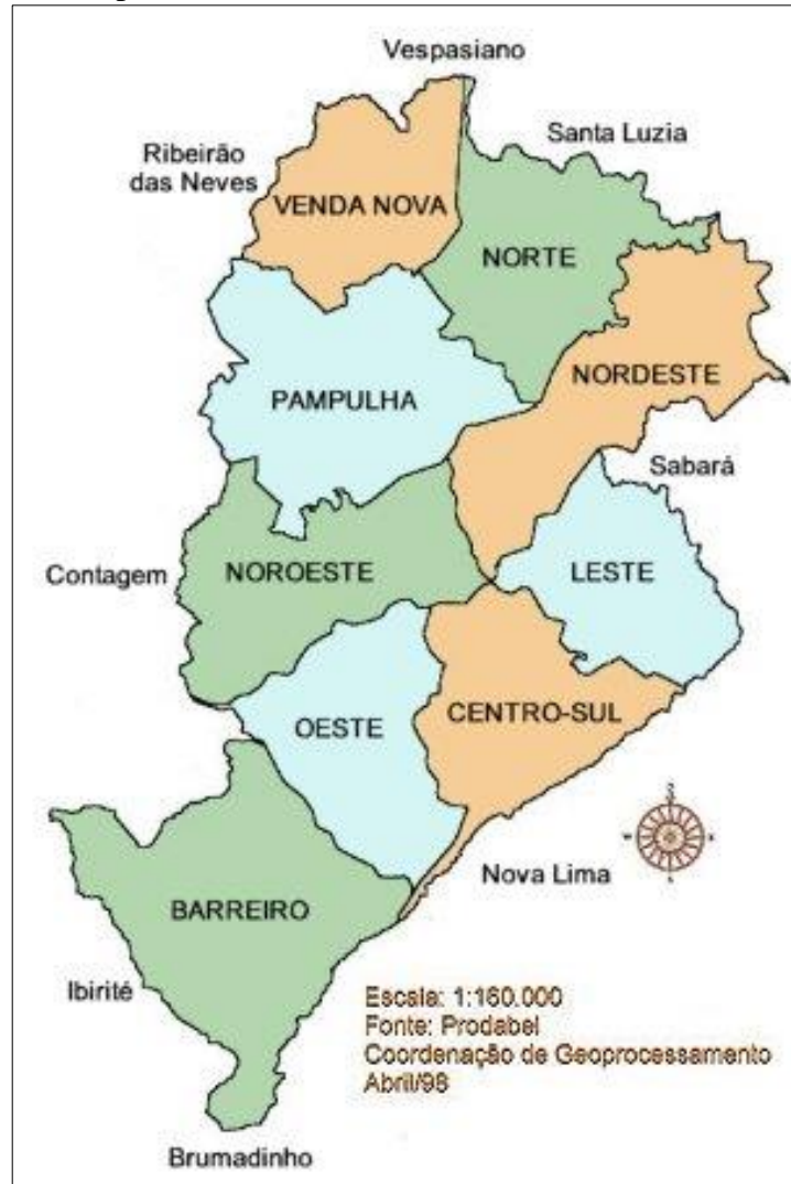
Mapa 1 – Distritos Sanitários de Belo Horizonte