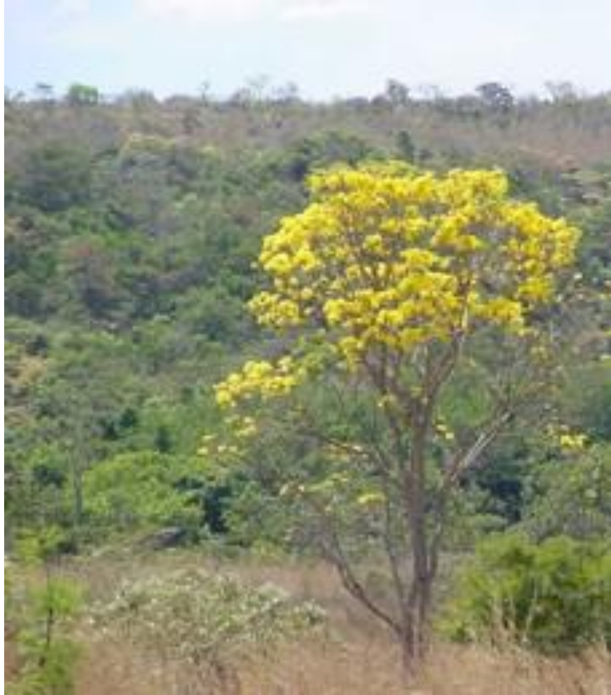
Imagem 1 – Bioma Cerrado