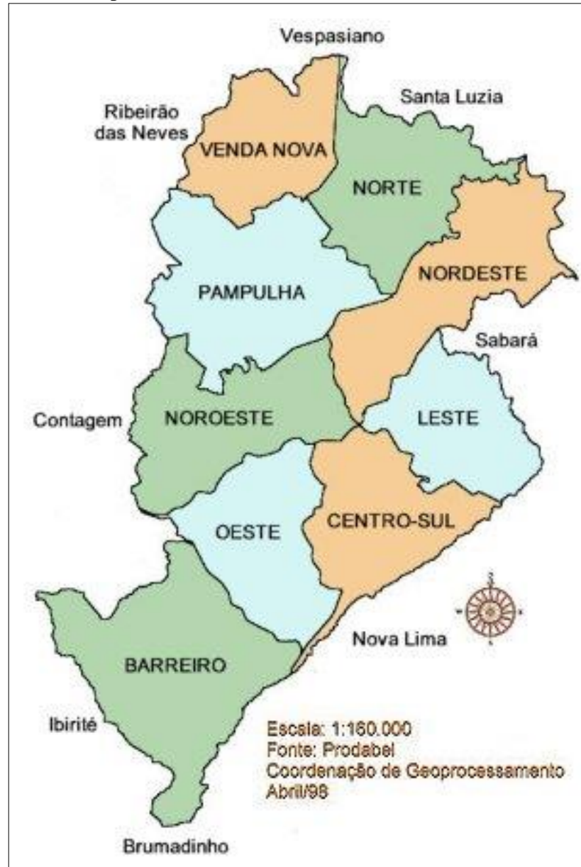
Mapa 1 – Distritos Sanitários de Belo Horizonte