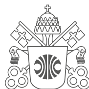
PUC Minas Praça da Liberdade