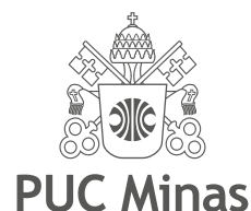
80% de preto