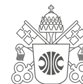
Brasão sem o termo PUC Minas