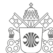
PUC Minas São Gabriel