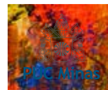
Brasão em fundos coloridos