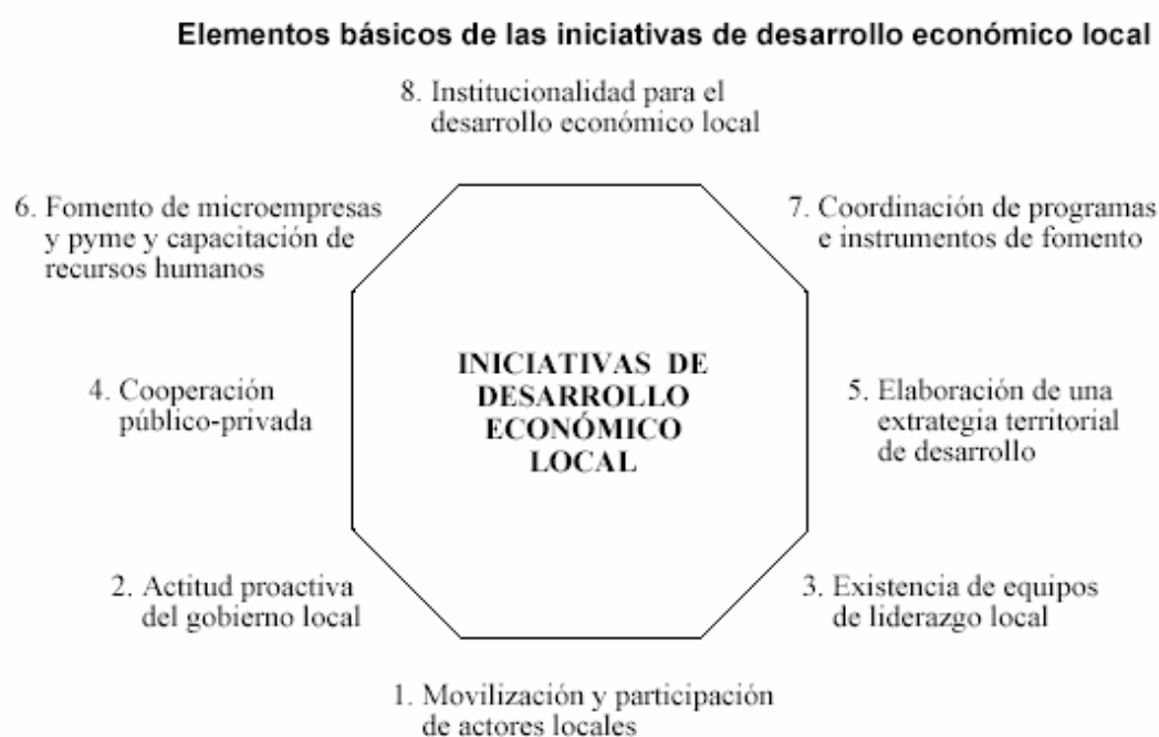
Figura 2: Elementos básicos de las iniciativas del desarrollo económico local

objetivos de estas iniciativas locales son: i) valorización mayor de los recursos internos de cada ámbito local; ii) organizar redes locales entre actores públicos y privados; iii) búsqueda de nuevas fuentes de empleo; iv) promoción de actividades del desarrollo científico y tecnológico; v) establecimiento de consorcios intermunicipales a fin de incrementar la eficacia y eficiencia de las actividades de desarrollo local; vi) creación de nuevos instrumentos de financiamiento para atender a las microempresas y pequeñas empresas locales; vii) incorporación de políticas de comercialización de ciudades para promover la competitividad sistémica territorial; viii) búsqueda de acuerdos estratégicos en relación con los bienes ambientales y del desarrollo sustentable. (ALBURQUEQUE, 2004, p.162).