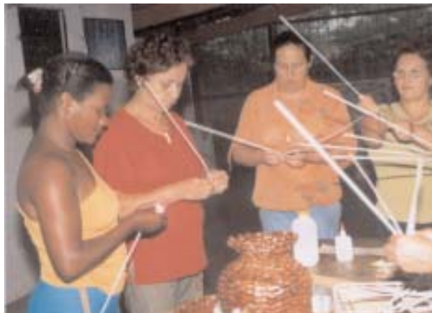
Artesãs de Iguatama: projeto desenvolve talentos e resgata auto-estima

poucos, os talentos foram se revelando e, hoje, além das oficinas e dinâmicas promovidas pelas estagiárias, elas ensinam e aprendem a confeccionar, tecer e manusear materiais. Aulas de crochê, corte e costura e a produção de artes com jornais dão forma a objetos que são comercializados. O projeto tem se apresentado em eventos e feiras, como o II Congresso Brasileiro de Psicologia, Ciência e Profissão (SP), no mês de setembro.