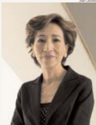
A representante da ONU, Kim Bolduc, aponta a diminuição da desigualdade de renda no Brasil