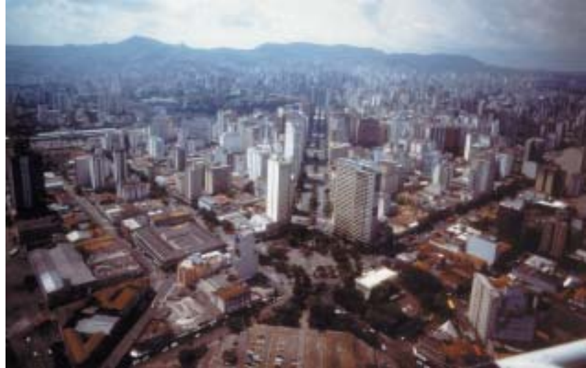
Além de Belo Horizonte, Ribeirão das Neves e Santa Luzia são as cidades que registram os maiores índices de criminalidade na RMBH

Os pesquisadores cruzaram os indicadores de integração com um banco de dados cedido pela Polícia Militar de Minas Gerais (PMMG), que compreende os anos de 1995 a 2003. Foram pesquisados os índices de crime contra a pessoa e crime contra o patrimônio, isto é, homicídio,