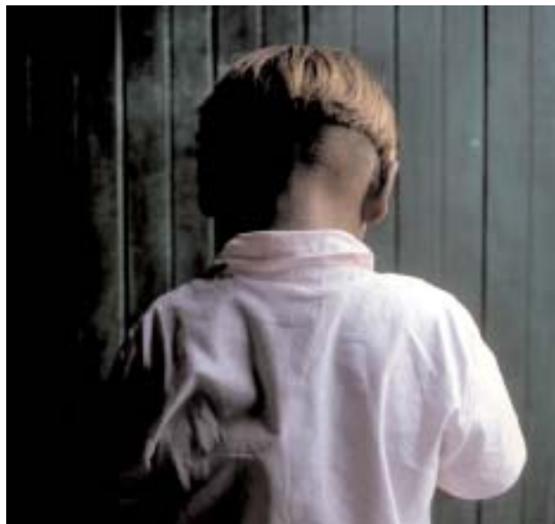
A negligência com crianças é um fato recorrente quando se trata de violência doméstica

A marca mais comum das crianças que sofreram esse tipo de