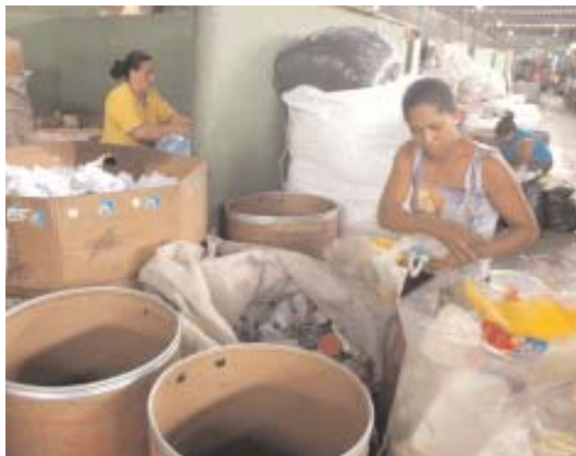
Catadoras de papel no galpão da Asmare: prática coletiva de trabalho como alternativa de sobrevivência

Antunes ponderou a mudança no próprio nome do trabalho. Ele afirmou para a plateia que participava do IV Seminário Internacional Sociedade Inclusiva, realizado entre os dias 17 e 20 de outubro, na PUC Minas, que "os trabalhadores agora viraram colaboradores, consultores, parceiros. O capital se apropria do aspecto cognitivo dos trabalhadores e o