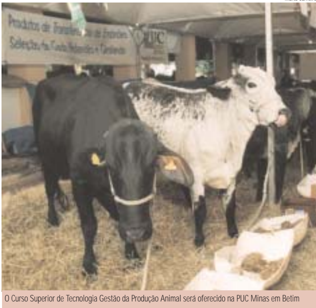
O Curso Superior de Tecnologia Gestão da Produção Animal será oferecido na PUC Minas em Betim