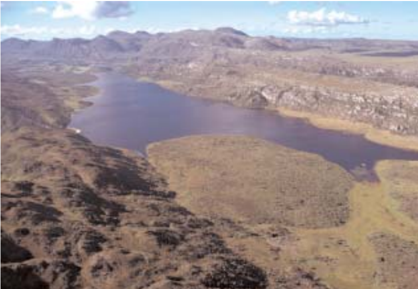
Região da Serra do Espinhaço que recebeu o título de Reserva da Biosfera, graças ao esforço conjunto de biólogos da PUC e outras instituições

De 20 anos para cá, a mídia vem divulgando um conceito que sintetiza as preocupações em relação ao meio ambiente e à conservação da vida humana no planeta: o conceito de “desenvolvimento sustentável”. Definido em 1987 pela ONU como o desenvolvimento que “satisfaz as necessidades do presente sem comprometer as necessidades das futuras gerações”, desde então passou a receber contribuições das mais variadas áreas do conhecimento, tornando-se um novo paradigma para as ações do ho-