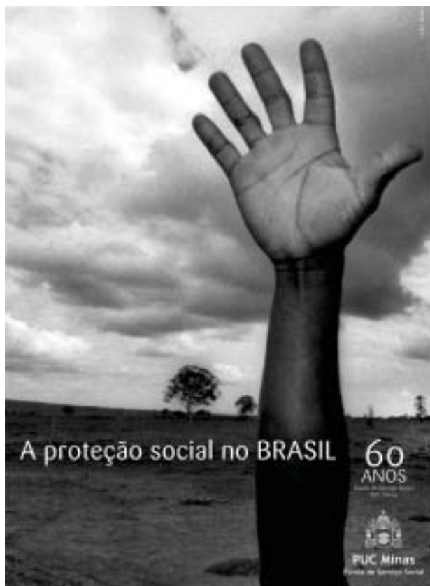
Peça publicitária sobre a comemoração dos 60 anos da Escola de Serviço Social da PUC Minas