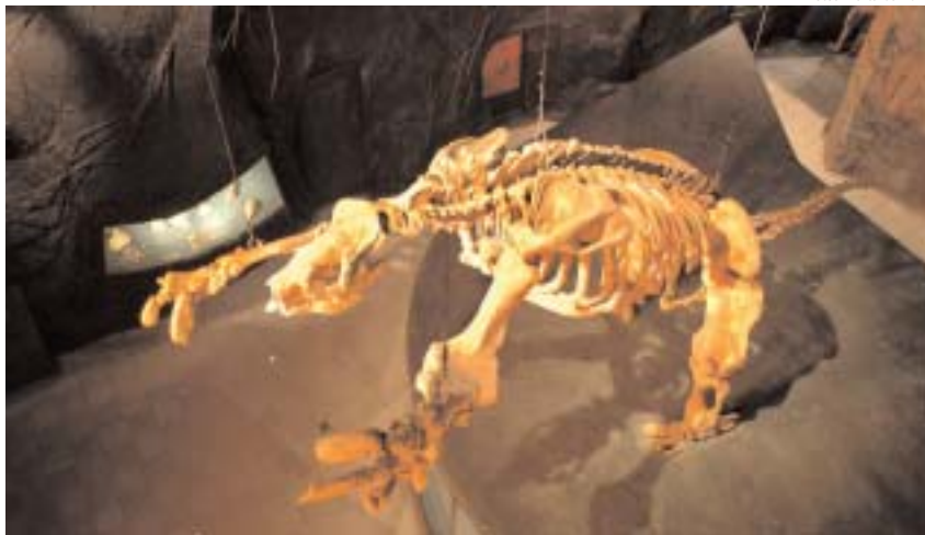
Esqueleto de preguiça gigante, uma das espécies que viveram no cerrado brasileiro há 11 mil anos